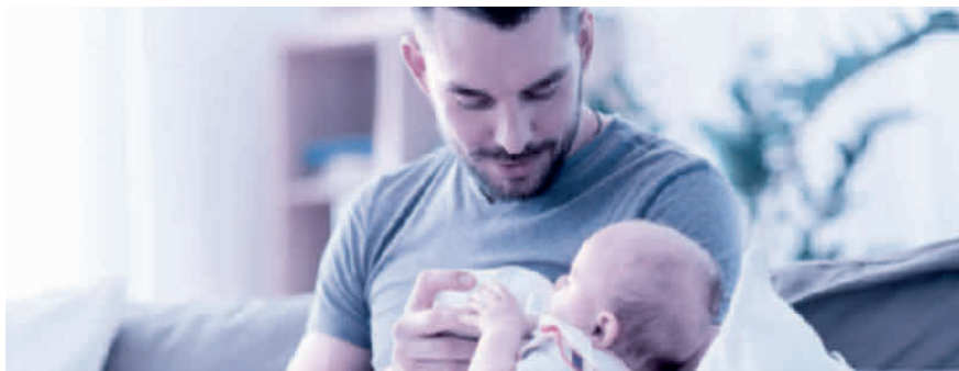
Vaterschaftsurlaub: innert sechs Monaten nach der Geburt zu beziehen.

Das Unternehmen muss dem Vater zehn arbeitsfreie Tage gewähren und hat für diese Zeit Anspruch auf 14 Taggelder. Es ist Sache des Arbeitgebers, bei der Ausgleichskasse – welche auch die EO-Beiträge abrechnet – den Antrag auf die Vaterschaftsentschädigung zu stellen. Der Antrag sollte aber erst gestellt werden, wenn der Arbeitnehmer den ganzen Vaterschaftsurlaub bezogen hat und der Arbeitgeber dies mit dem Antrag bestätigen kann. Die Auszahlung der Vaterschaftsentschädigung erfolgt dann nachgelagert